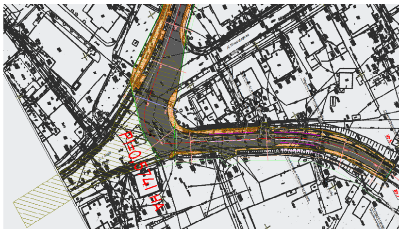
Rysunek 1. Powierzchnia zlewni - fragment ul. Legnickiej i ul. Wrocławskiej w Zabkowicach Śląskich

W ramach niniejszego opracowania obliczono ilość odprowadzonych wód deszczowych do projektowanej kanalizacji, w celu zapewnienia ich odbioru.