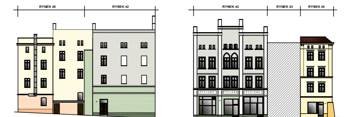
Usytuowanie w ciągu kamienic