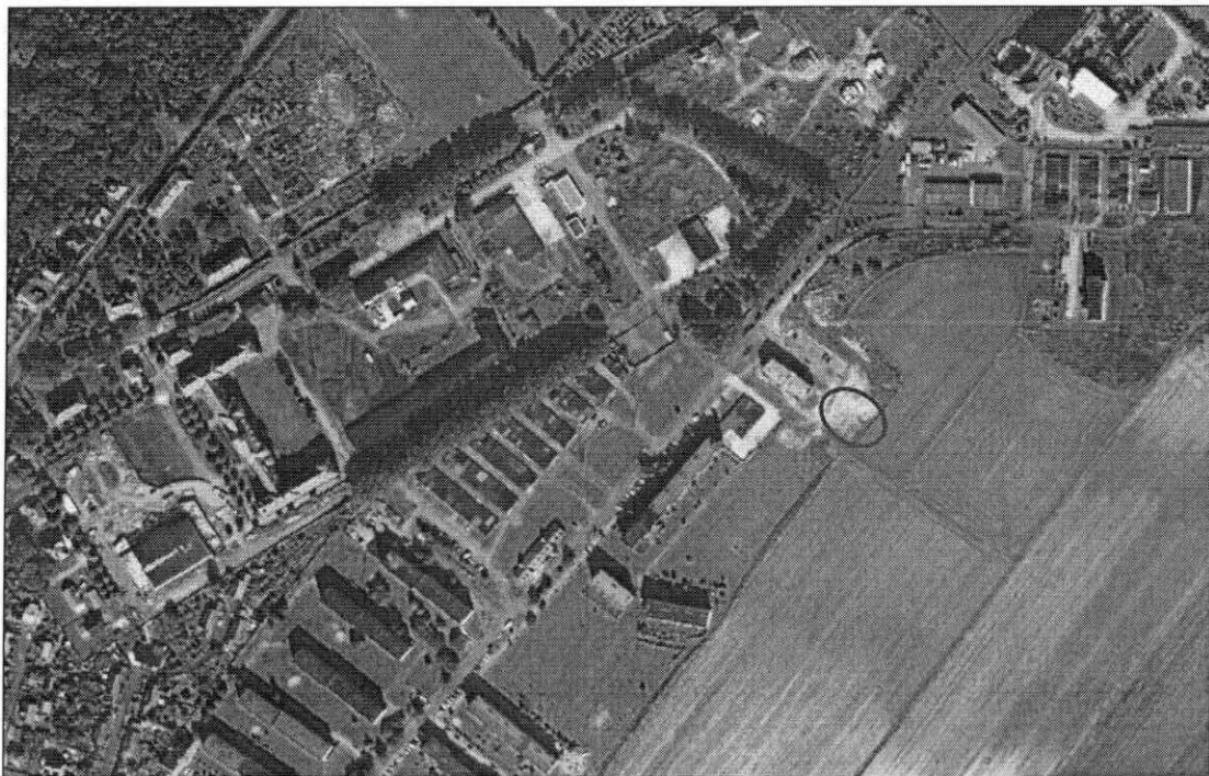
Zdjęcie nr 3. Lokalizacja działki na terenie Ząbkowic Śląskich