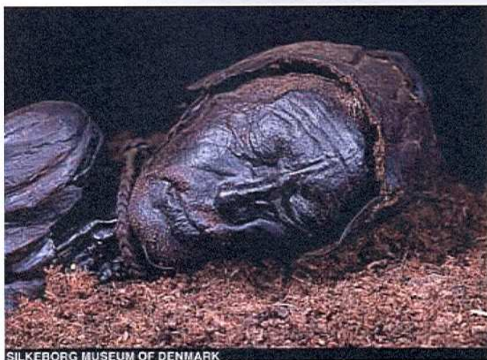
SILKEBORG MUSEUM OF DENMARK